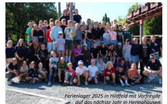
Ferienlager 2025 in Hildfeld mit Vorfreude auf das nächste Jahr in Heringhausen