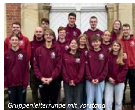
Gruppenleiterrunde mit Vorstand

Die Messdienergemeinschaft ist damit gut gewappnet für 2026 und freut sich auf viele lustige und abwechslungsreiche Erlebnisse.