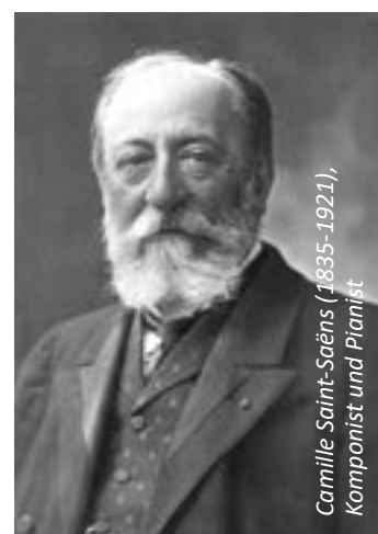
Camille Saint-Saëns (1835-1921), Komponist und Pianist

Das eher kammermusikalisch gearbeitete Oratorium zeichnet sich durch eine lyrische Grundstimmung aus, nur selten klingen dramatischere Töne an.