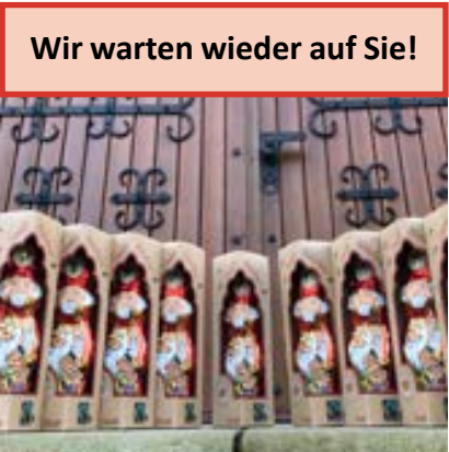
Wir warten wieder auf Sie!