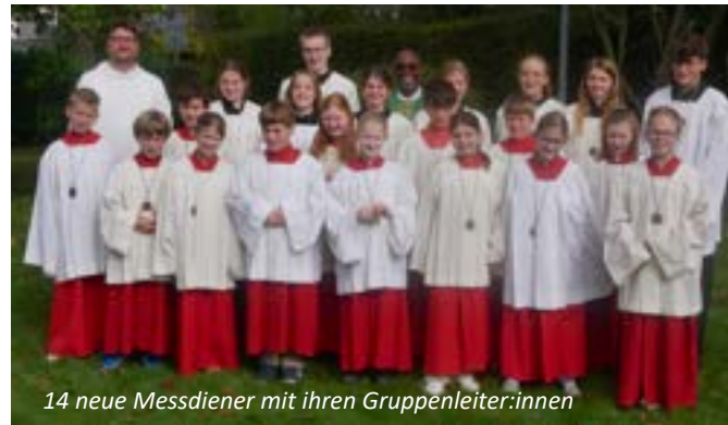
14 neue Messdiener mit ihren Gruppenleiter:innen

Schon seit einigen Jahren sind mehrere Jugendliche bei den Messdiener:innen dabei, die dafür bei der